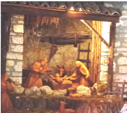
Crèche dans la chapelle de Greccio

« Le peuple qui marchait dans les ténèbres a vu se lever une grande lumière... Oui, un enfant nous est né, un fils nous a été donné ! Sur son épaule est le signe du pouvoir ; son nom est proclamé : Conseiller-merveilleux, Dieu-fort, Père-à-jamais, Prince-de-la-Paix... » Isaïe 9 – 1, 6